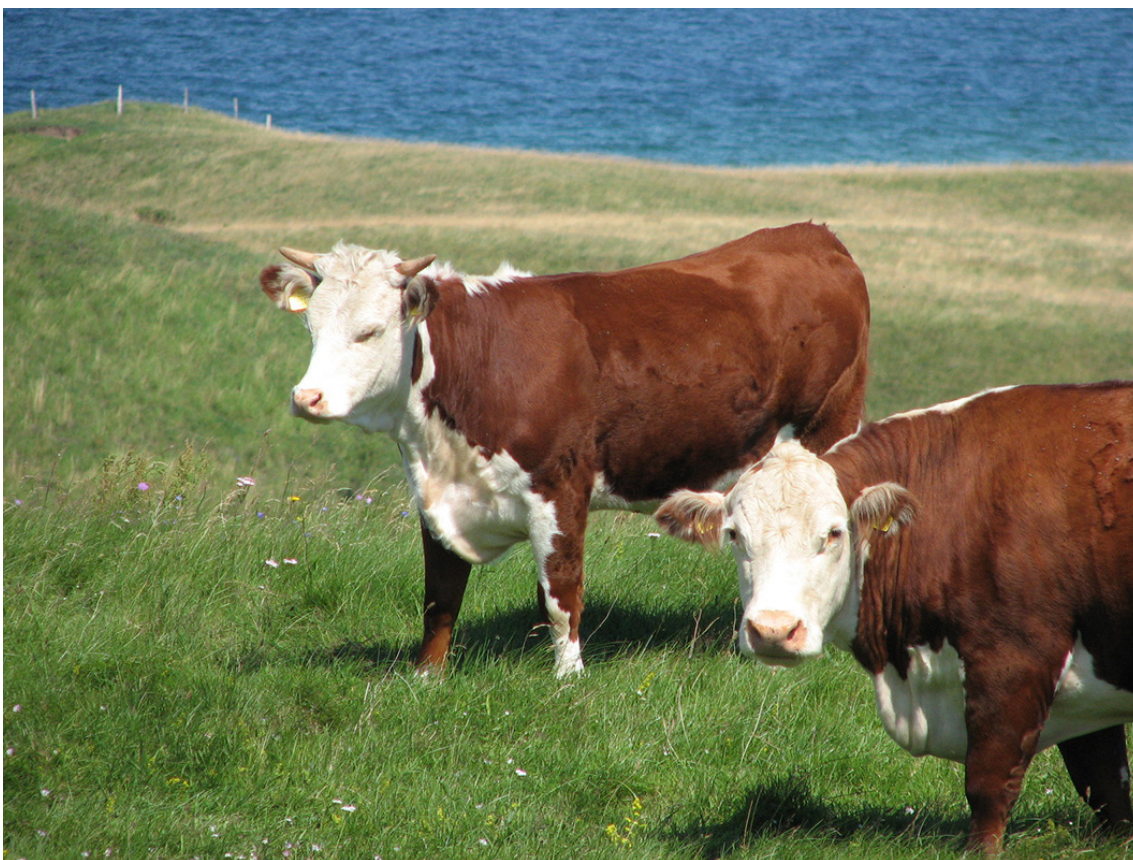
Græssende kreaturer giver flere blomster og større biodiversitet.