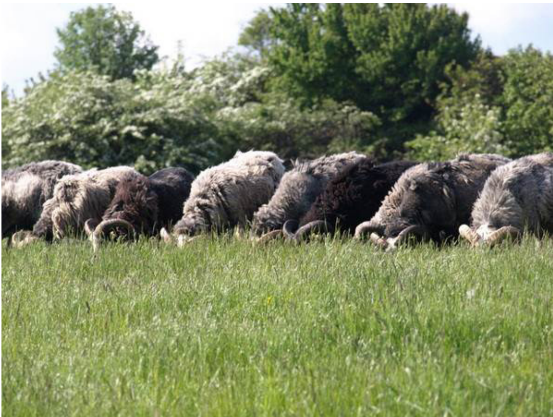
Gutefår som effektive naturplejere.