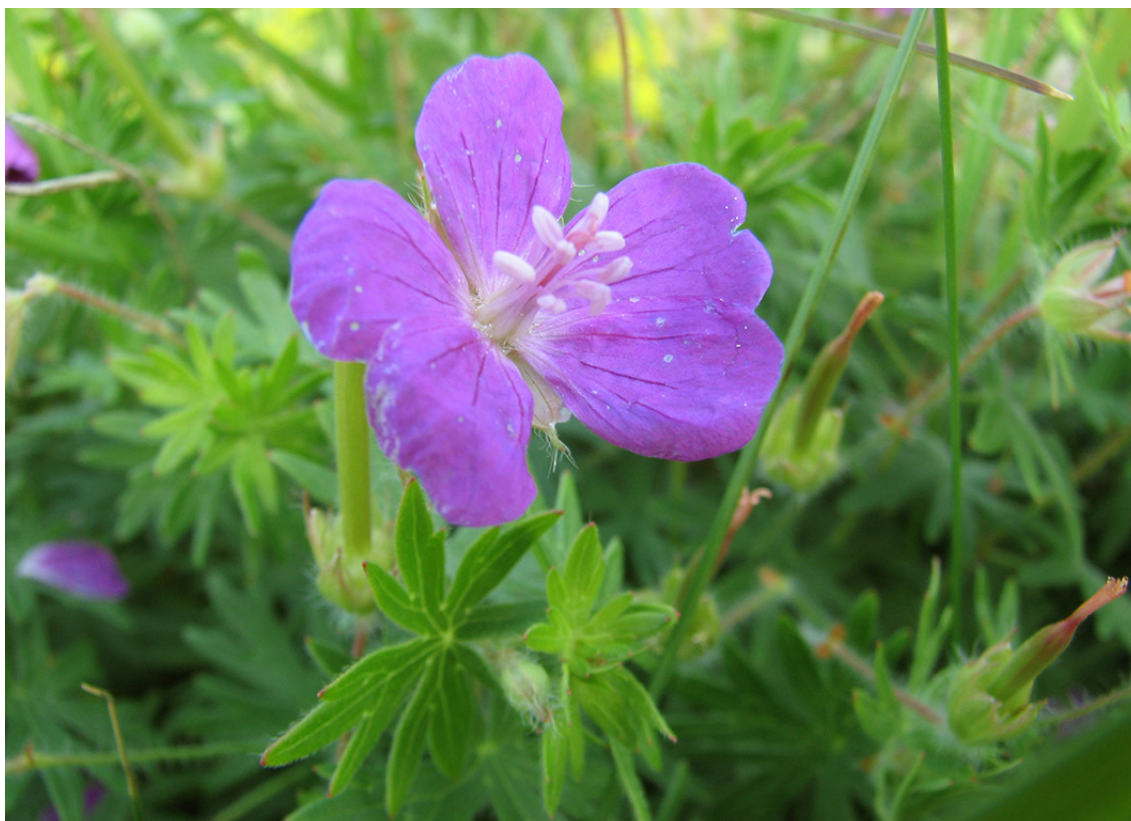
Blodrød Storkenæb – en karakterart på de tørre og solrige overdrev.